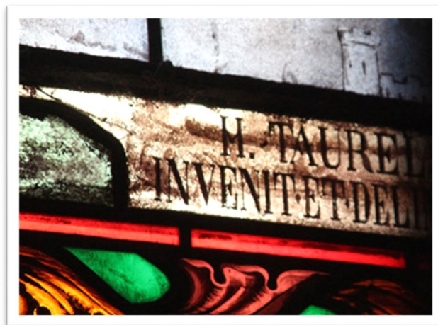
Vitrail de l'église Sainte Marie-Madeleine