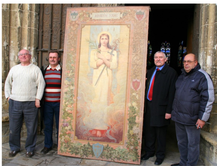
Tableau « Jeanne d'Arc », église Sainte Marie-Madeleine