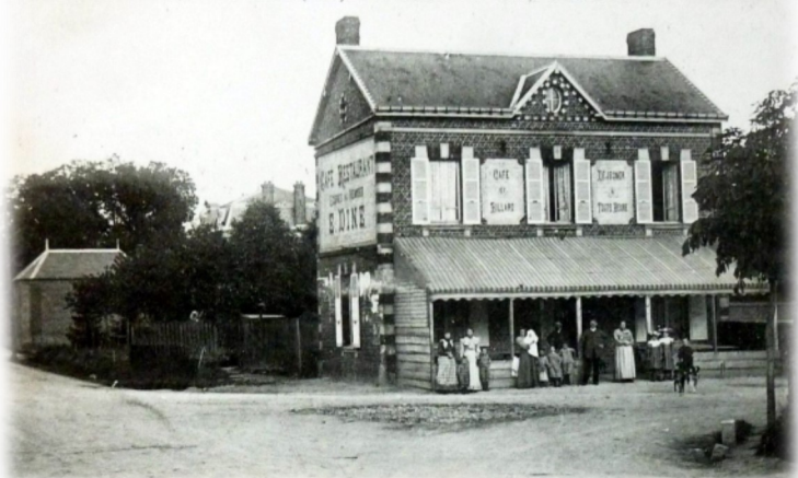
Arr. de Clermont (Oise). — MAIGNELAY. — Café de la Gare.