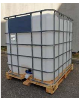
récupérateur 1 000 L : 70 €