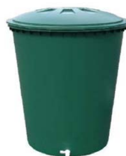
récupérateur 310 L : 30 €