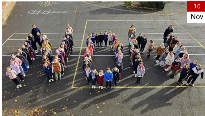
Cérémonie du 11 novembre avec l'école Gabriel Bourgeois