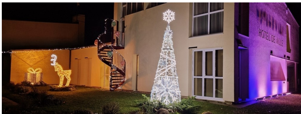
Installation des décorations de Noël avec les enfants du périscolaire